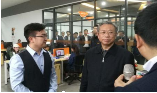
图 8：山东省委书记刘家义莅临艺点意创菏泽分公司调研工作