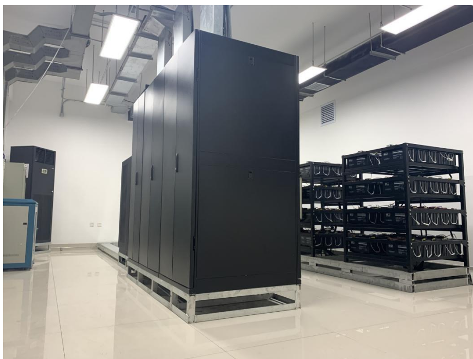
图3 A级标准建设的数据中心机房配电室

数据中心双机房升级改造顺利完成。青岛工学院数据中心双机房升级改造工程已经全部完成并投入使用。新机房区域总面积 491 平方米，包括主机房、配线间、UPS 配电室、耗材库、开发室、办公室、总控中心共 7 个功能区，整体项目于 2019 年 7 月完工并已通过试运行，为智慧校园各业务系统建设提供了安全可靠的运行环境。整个机房系统按实用并具备前瞻性的理念进行设计，主体按国家标准 B 级，关键系统 A 级标准建设，共包括了装修、电气、暖通、综合布线、模块化机柜、环境监控、机房消防 7 个子系统。主机房首期配置 1 个微模块，包括 13 台服务器机柜，1 台强电列头柜及 2 台 40KW 行间级精密空调。配线间配置 6 个网络机柜，UPS 配电室配置 2 台市电配电柜、1 台 UPS 输出配电柜等相关设备，终期可平滑扩容为 27 台服务器机柜，4 台 40KW 行间精密空调，充分满足智慧校园建设整体需求。