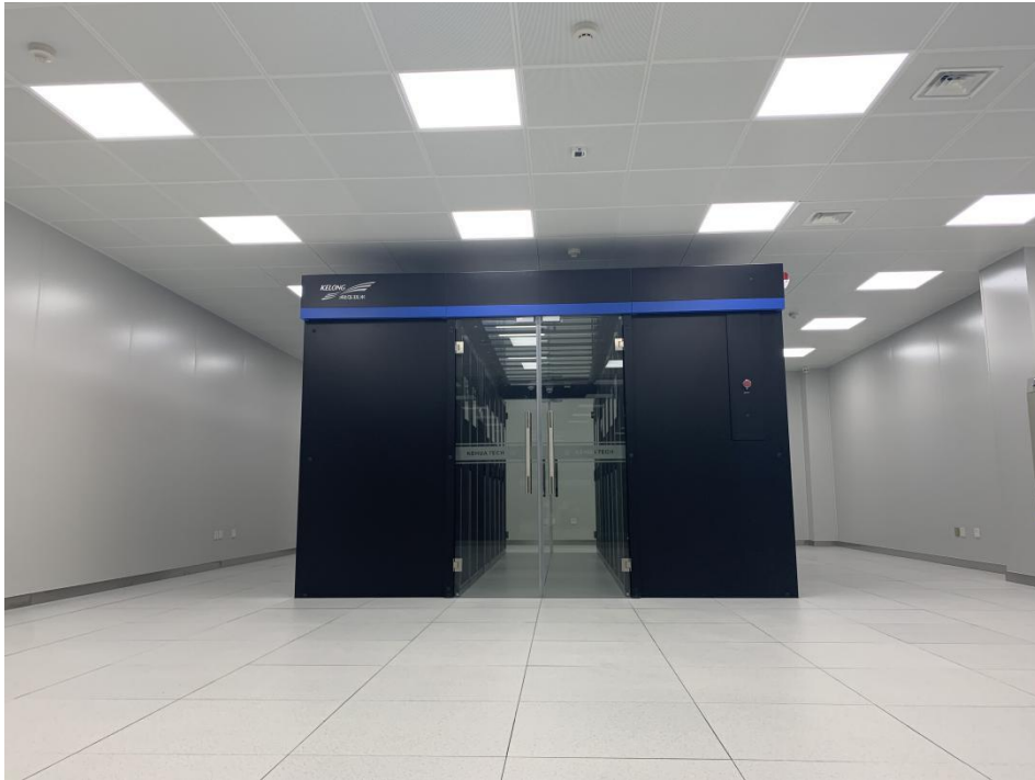
图4 高效、节能、可扩展的数据中心模块式冷通道机房

平安校园系统建设。平安校园系统是智慧校园的重点工程，在提高校园安全管理水平，并满足标准化考场和标准实验室建设同时，形成校园人员活动大数据，为基于大数据的智慧管理提供基础数据支撑。整个系统基于人脸识别技术实现，包含中央管理平台、前端监控系统、平安校园专网、机动车管理系统、访客管理系统、宿舍区出入口管理系统等多个模块，建设总投资近千万，系统实现全校所有教室的标准化考场建设，并为实验室课余时间全面开放提供安全保障，为学生提供一流的课外学习环境，整个项目正在实施过程中。