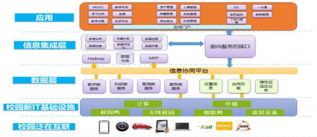
图1 智慧校园系统框架