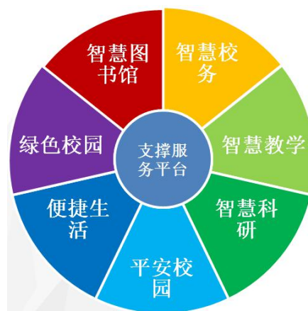
图2 智慧校园总体建设内容

智慧校园整体建设以基础网络环境改造、共享式数据中心、统一信息门户建设为基础，重点围绕智慧校务、智慧教学、智慧科研、平安校园、便捷生活、绿色校园、智慧图书馆7个核心分阶段进行建设。总体计划投入资金3300余万元。规划及建设过程严格遵循面向未来、统筹规划、突出重点、逐步实施、应用驱动、讲求实效的原则。总体建设内容见图2。